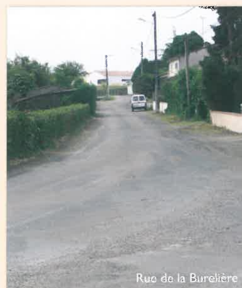
Rue de la Burelière