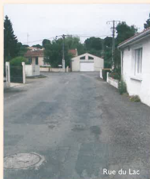
Rue du Lac

Les travaux de la rue du Lac et d'une partie de la rue de la Burelière vont démarrer en septembre-octobre. Le revêtement sera totalement refait en bitume et un trottoir franchissable sera créé sur un côté de la voie.