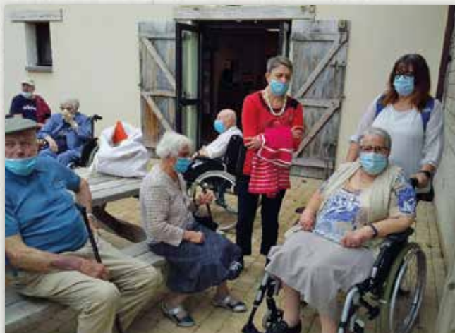
Sortie à Saint Gilles Croix de Vie dans le cadre de l'animation « Revisitez l'histoire de vos villages » avec la Résidence de l'Herm de SAINT Michel en l'Herm et la Résidence les Coteaux du Lac de Poiroux

Malgré cette actualité tristounette, les résidents ont tout de même pu participer à une sortie dans le cadre de l'animation financée par la Conférence des Financeurs (Conseil Départemental de la Vendée). La visite du village miniature de Vendée et la ballade au bord de mer a réchauffé les cœurs de chacun !