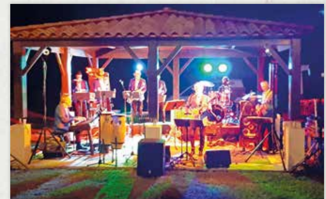
Le 3 juillet 2020 avec les Gypsies 70's.